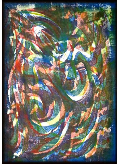
العمل رقم (٤)