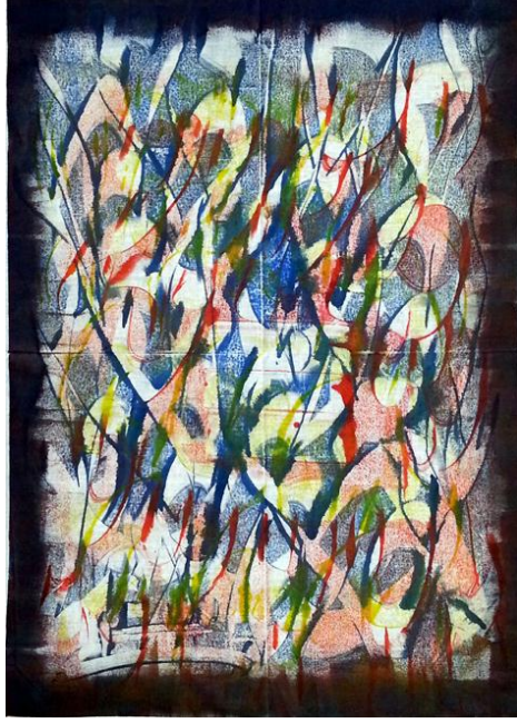
العمل رقم (٥)