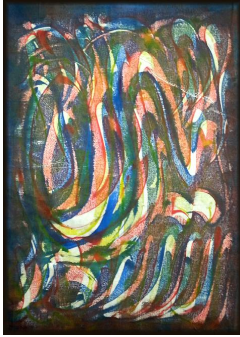
العمل رقم (١)