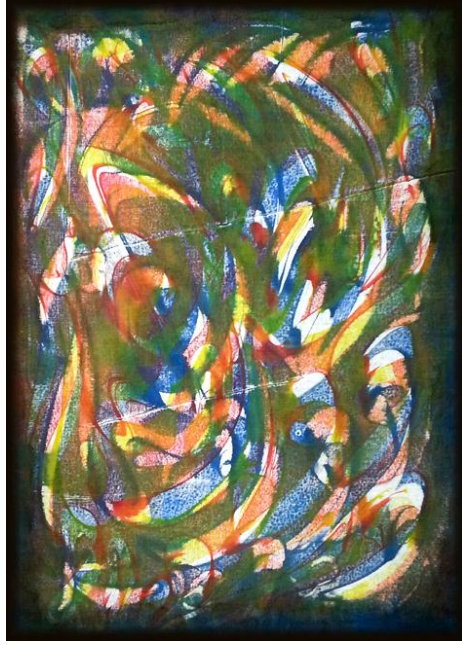
العمل رقم (٣)