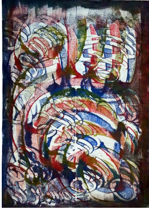
العمل رقم (٧)