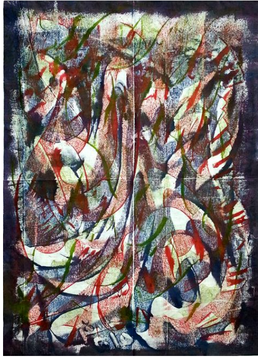
العمل رقم (٨)