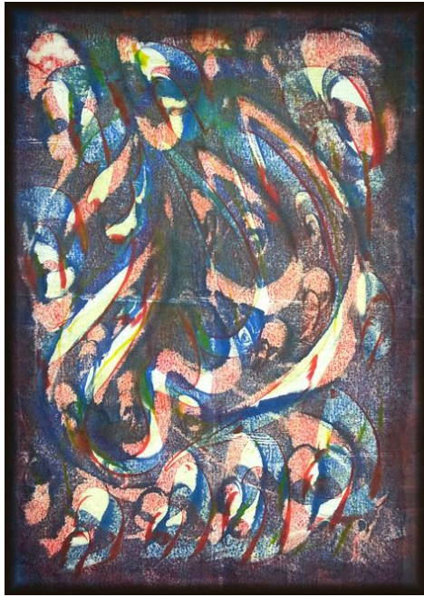
العمل رقم (٢)